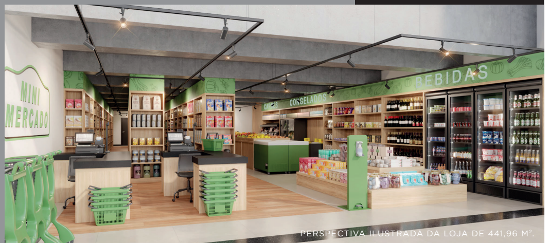
PERSPECTIVA ILUSTRADA DA LOJA DE 441,96 M².

PARA QUEM DESEJA FAZER BONS NEGÓCIOS, O PONTO COMERCIAL É ESTRATÉGICO. O HUB CONTÉM UMA EXCELENTE INFRAESTRUTURA INTERNA E EXTERNA. E POSSUI POSIÇÃO ESTRATÉGICA EM RELAÇÃO AO ENTORNO DE COMÉRCIOS, SERVIÇOS, EMPRESAS E CULTURA.