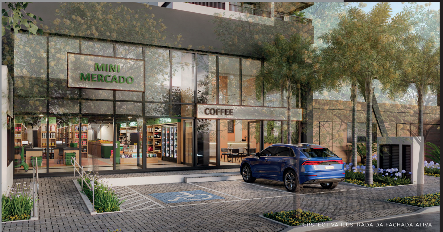
PERSPECTIVA ILUSTRADA DA FACHADA ATIVA.

NOSSAS LOJAS POSSUEM ESPAÇOS IDEIAIS PARA DIVERSOS TIPOS DE COMÉRCIO E ESTÃO POSICIONADAS ABAIXO DE 263 UNIDADES DE STUDIOS RESIDENCIAIS.