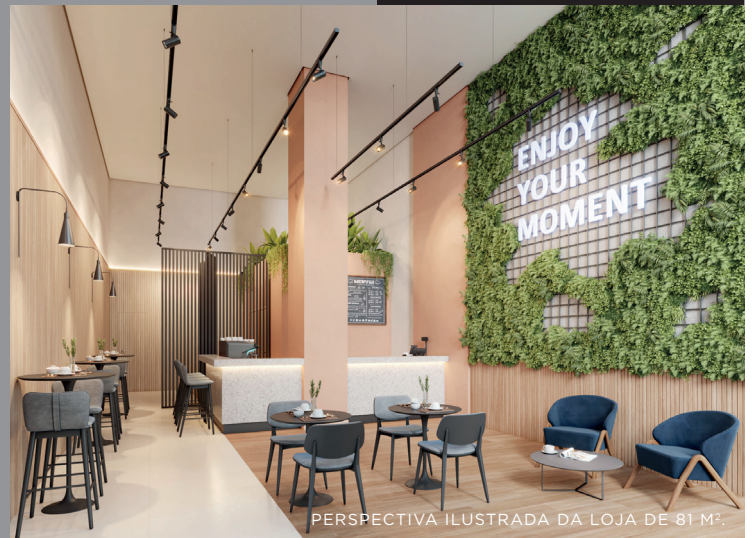
PERSPECTIVA ILUSTRADA DA LOJA DE 81 M².

UMA OPORTUNIDADE INÉDITA PARA EXPANDIR O SEU NEGÓCIO E AMPLIAR AS CHANCES DE ATINGIR UM NOVO FLUXO DE TRANSEUNTES DIARIAMENTE, QUE ACABAM POR DESTACAR AINDA MAIS O PONTO DA REGIÃO. A VALORIZAÇÃO COMEÇA A PARTIR DA LOCALIZAÇÃO ESTRATÉGICA A APENAS MINUTOS DA ESTAÇÃO ADOLFO PINHEIRO, COM PROXIMIDADE AO HOSPITAL LUZ E ÀS RENOMADAS UNIVERSIDADES FMU, CRUZEIRO DO SUL E OUTRAS.